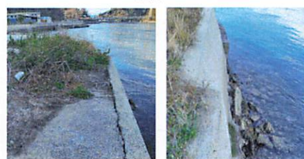
※海沿いの石垣が崩れぎみ